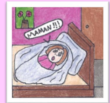
Olivia se cache sous ses couvertures.