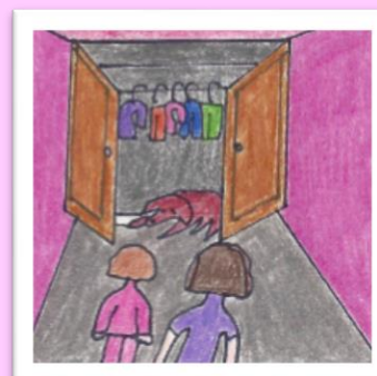
Surprise! C'est le chien qui dort dans la garde-robe!