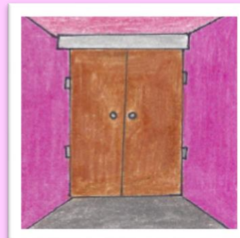
Un bruit provient de sa garde-robe.