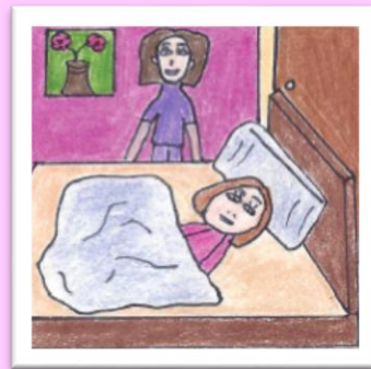
Olivia est rassurée par la présence de sa mère, Sabrina.