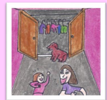
Olivia et sa mère trouvent cela drôle. Olivia retourne se coucher.

Regard9 outille les parents, les professionnels de la santé et de l'éducation par le biais de conférences, de livres, de jeux et de capsules d'information gratuites.