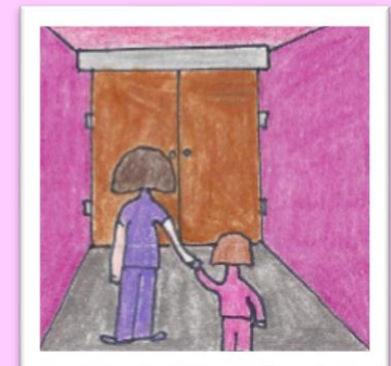
Olivia tient la main de sa mère en se dirigeant vers la garde-robe.